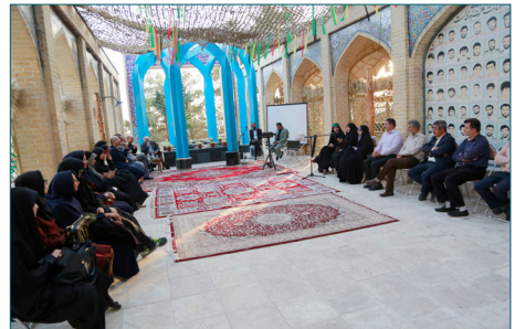
نمایشگاه هفته دفاع مقدس و رونمایی از پورتال «حدیث جنگ»