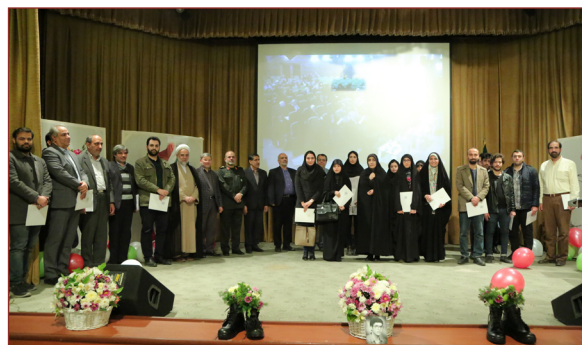
هشتمین گردهمایی جامعه شاهد و ایثارگر و تقدیر از دانشجویان برتر آموزشی و پژوهشی