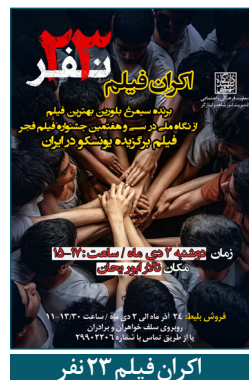
اکران فیلم ۲۳ نفر