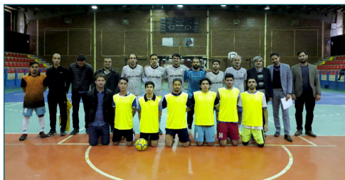
مسابقه فوتسال دوستانه