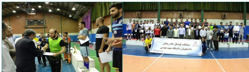
قهرمانی تیم فوتسال کانون فرهنگی ایثار