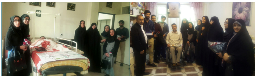
دیدار با جانبازان مرکز توانبخشی حضرت امام خمینی (ره)