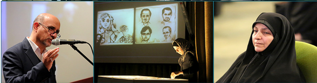
پاسداشت نهمین سالگرد شهادت شهید دکتر شهبازی و یادواره شهیدای هسته‌ای