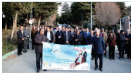
پیاده روی به مناسبت گرامیداشت دهه مبارک فجر