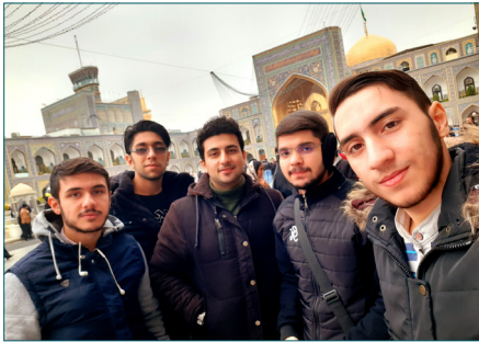
اردوی مشهد مقدس