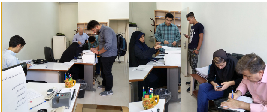
ثبت نام حضوری دانشجویان شاهد و ایثارگر در دانشگاه