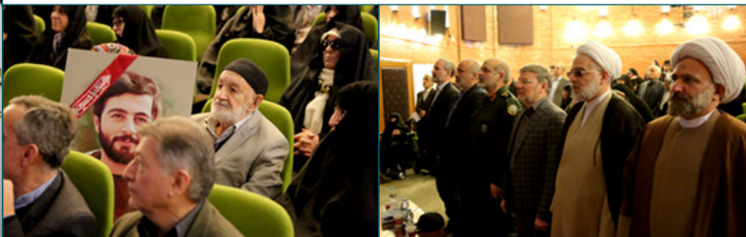
چهل و یکمین سال پیروزی انقلاب اسلامی و یادواره شهیدای دانشگاه شهید بهشتی و علوم پزشکی و هشتمین گردهمایی جامعه شاهد و ایثارگر