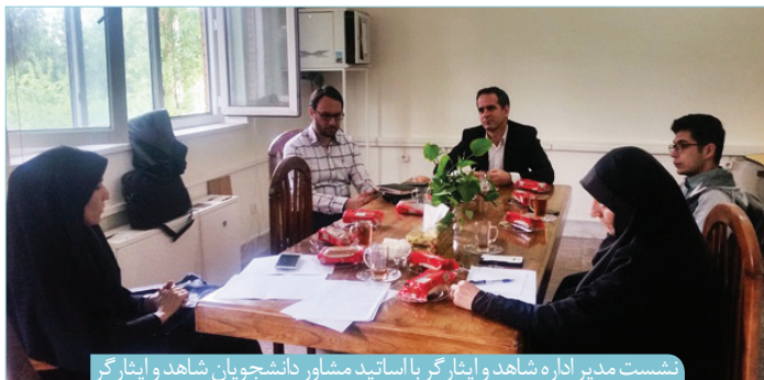
نشست مدیر اداره شاهد و ایثارگر با اساتید مشاور دانشجویان شاهد و ایثارگر پردیس فنی و مهندسی شهید عباسپور