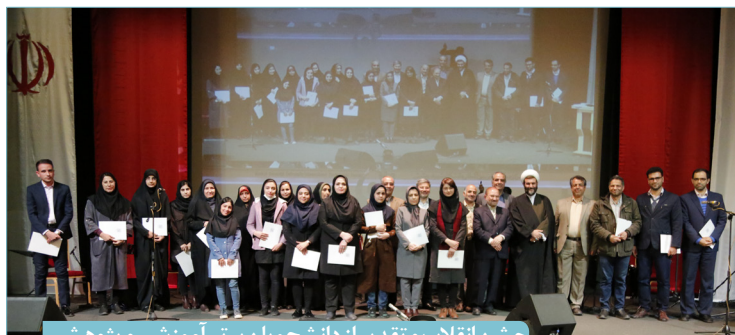
جشن انقلاب و تقدیر از دانشجویان برتر آموزشی و پژوهشی