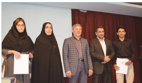
تقدیر از دانشجویان برتر کنکور سراسری در اردوی معارفه