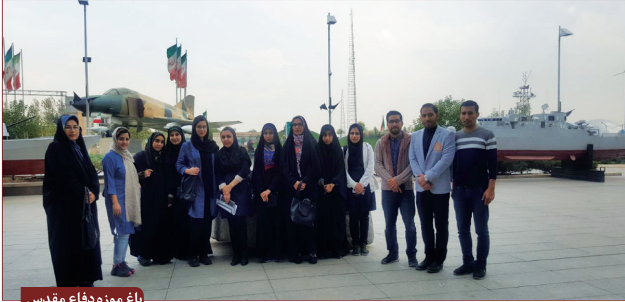
باغ موزه دفاع مقدس