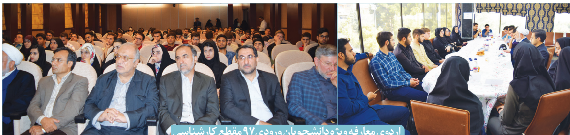
اردوی معارفه ویژه دانشجویان ورودی ۹۷ مقطع کارشناسی