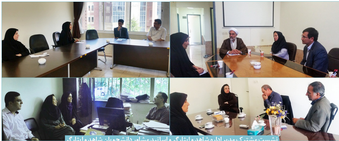
نشست مشترک مدیر اداره شاهد و ایثارگر و اساتید مشاور دانشجویان شاهد و ایثارگر