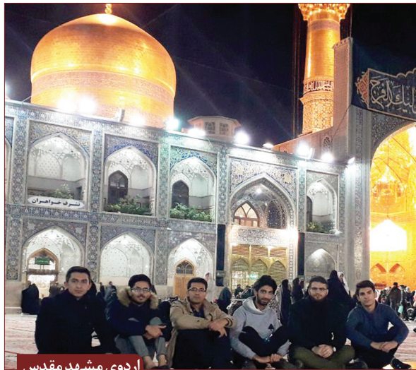
اردوی مشهد مقدس