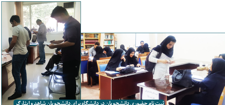
ثبت نام حضوری دانشجویان در دانشگاه برای دانشجویان شاهد و ایثارگر